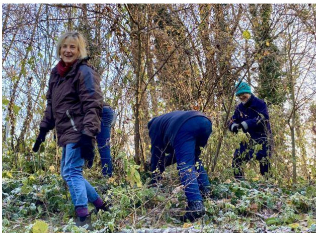
22.11.: Arbeitseinsatz auf dem Kräuterberg