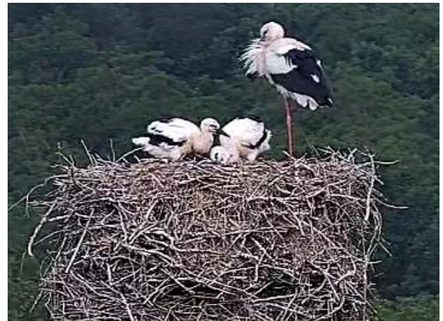
10.07.: Auch 2025 gab es Nachwuchs bei den Störchen