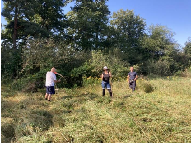
15.08.: 1. Arbeitseinsatz Egelpfuhle

Nach dem trockenen Frühjahr haben wir nur drei Exemplare der Orchideenart Epipactis helleborine (Breitblättrige Stendelwurz) wir vorgefunden (2024: 5).