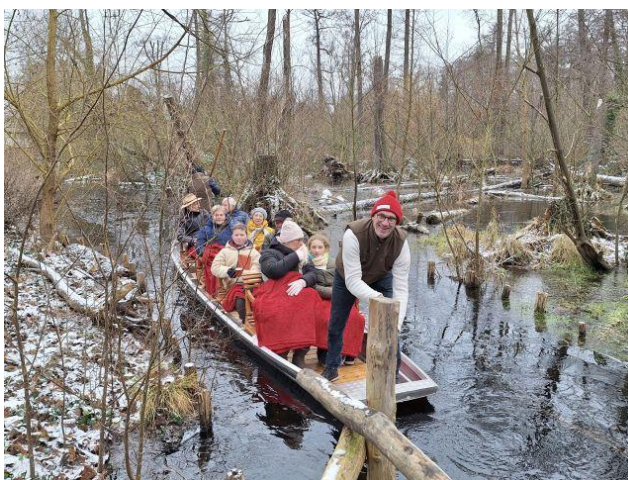
04.01. Winterkahnfahrten sind beliebt