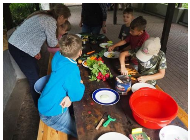
Gemüse zubereiten bei der Kindersommerwerkstatt