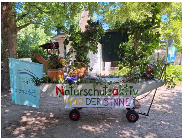
21.06.: Der kleine Spreewaldkahn des NAS für den Festumzug des Heimatfestes