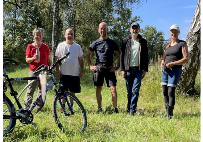
13.09.: 3. Arbeitseinsatz: Mahd und Beräumung