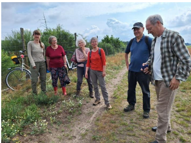
05.06.: Kartierung der krautigen Pflanzen

Ergänzend zur Kartierung im Oktober 2024 wurden am 05.06.25 die krautigen Pflanzen im 1. Segment der Feldhecke nochmals kartiert und die Ergebnisse mit den vorherigen Kartierungen (2021 und 2024) verglichen. Dabei wurden insgesamt 44 Arten gefunden, darunter 20 neue Arten. 20 Arten wurden diesmal nicht entdeckt. Besondere Pflegemaßnahmen waren nicht mehr notwendig, da sich die Hecke inzwischen recht gut etabliert hat. Der Zaun wird in naher Zukunft entfernt werden können, wenn die Pfähle morsch werden. Wir danken Rainer und Elke Weidlich für die sorgfältige Dokumentation (s. TaskCards).