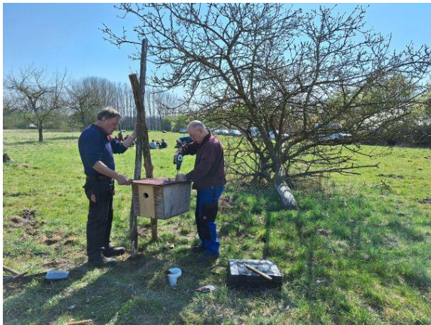
09.04.: Der Wiedehopfkasten wird umgebaut und versetzt.

Vier Teilnehmer*innen haben am 14. Februar die Kopfweiden an Buchalliks Fließwiese geschnitten. Die Zweige werden für verschiedene Zwecke (z. B. zum Bau von Weidenzäunen) im Kleinen Spreewaldpark genutzt. Der Schnitt erfolgt jedes Jahr.