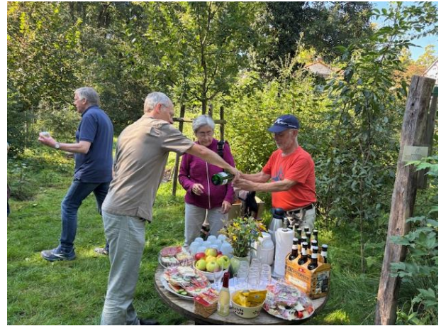
Fürs leibliche Wohl ist gesorgt.