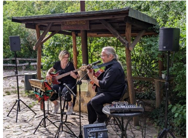
Für tolle Hintergrundmusik sorgte das Duo „Lovely Soul“ aus Schöneiche