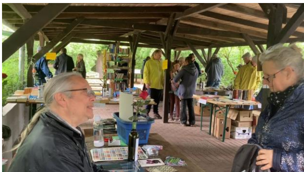
Die Bücherfeste waren wieder sehr erfolgreich