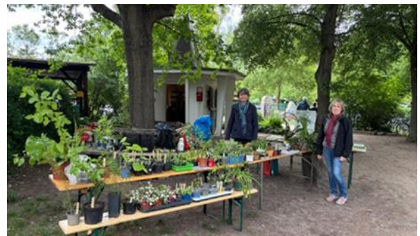
Im Mai freuten sich die Besucher auch über ein reichhaltiges Pflanzenangebot