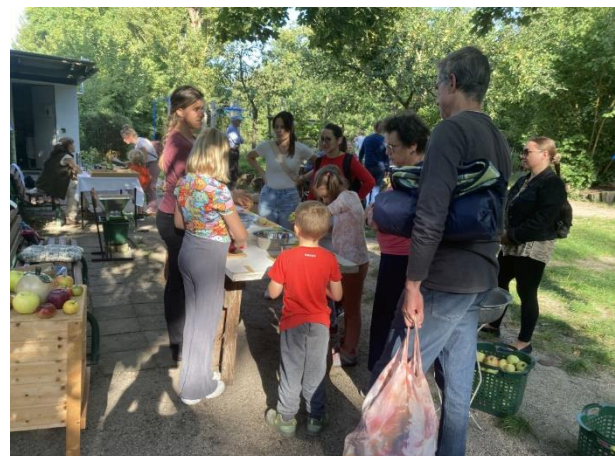
19.09.: Äpfel pressen beim Kinder- und Familienfest