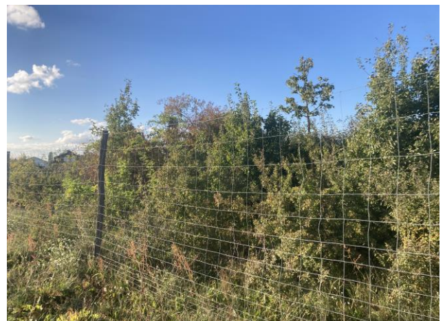
Die Feldhecke im Oktober