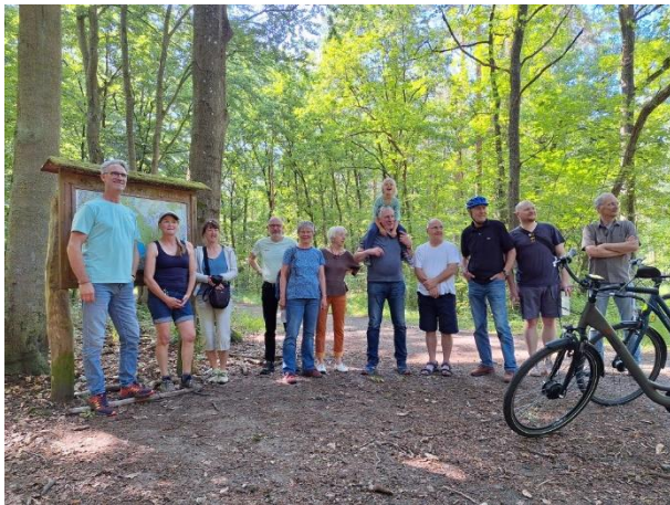
13.06.: Radtour zur Krummendamer Heide

Am 13.06. fand außerdem eine kleine Radtour zur Krummendamer Heide statt. Sie diente der Vorbereitung einer Stellungnahme zum Bau einer Windkraftanlage in dem Gebiet. Abgabe einer Stellungnahme erfolgte im Juli.