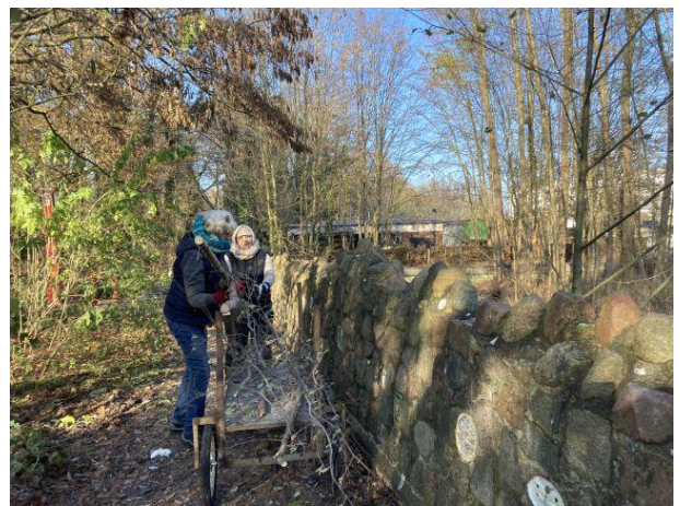
Die Äste bekommt der Biber im Dinoteich