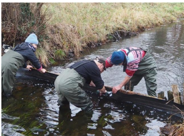
17.01. Staubohle wird im Fließ fixiert

Die jährliche Stausetzung im Fredersdorfer Mühlenfließ (FMF) erfolgte vom 17. - 28.01., wonach der Weidensee bis 20 cm unter dem Zulaufbauwerk (obere Betonkante) mit Wasser gefüllt war. Aufgrund des sehr trockenen Frühjahrs sank der Wasserstand im KSP Anfang Mai wieder so stark ab, dass die letzten Kahnfahrten am 1. Mai stattfanden.