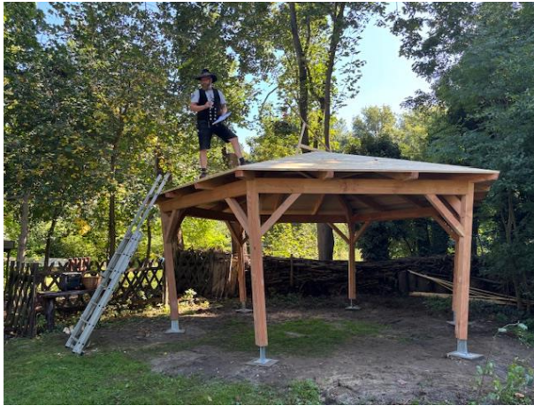
11.09.: Richtfest im Waldgarten