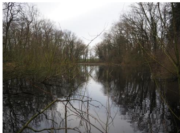
Gefüllter Weidensee am 28.01.