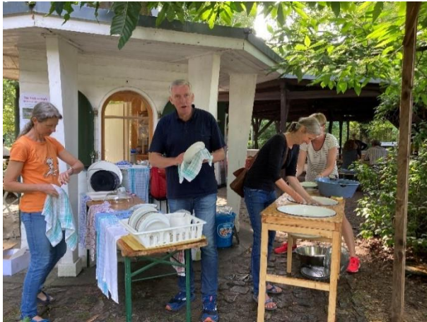
Sommercafé 2025 – viele fleißige Helfer am Werk