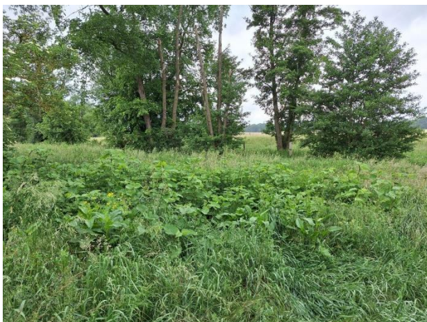
Japanischer Staudenknöterich am Fredersdorfer Mühlenfließ

In Schöneiche gibt es einige Vorkommen dieser invasiven Pflanze, deren Bekämpfung sehr schwierig ist. Daher gilt es, die Ausbreitung der Bestände zu verhindern. Ein Vorkommen gibt es auf der NABU-Wiese am Fließ. Dort wurden von den Anwohnern illegal Pflanzenreste abgelegt. Die Anwohnerin wurde am 05. 06. darauf hingewiesen und hat die Pflanzen entsorgt, soweit es möglich war. Hier wird auch in den kommenden Jahren Handlungsbedarf sein. Zwei weitere Vorkommen gibt es neben der Schlosskirche. Wir haben das Grünflächenamt darüber informiert. Leider wurde unserer Bitte um Beseitigung (aus Kostengründen) nicht entsprochen.